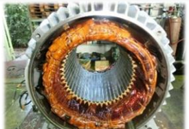
焼けてしまった電動機の交換