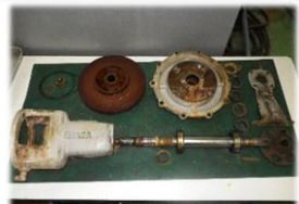
ポンプの分解整備部品交換