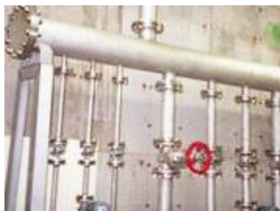
あらゆる配管の メンテナンスに対応！