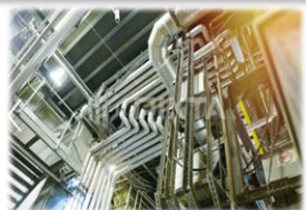
薬液などの特殊配管の修繕メンテナンス