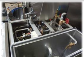
現場のスペースに合わせた設計制作