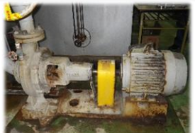
ポンプの錆防止のためのコーティング