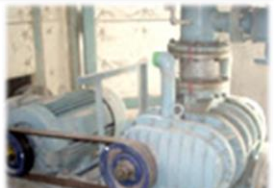
ファン・ブロワなどのメンテナンス