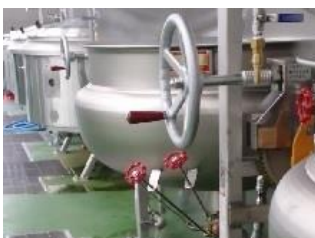
現場タンクの 補修を行います！