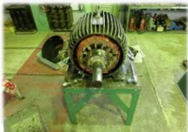
故障前の定期的なメンテナンス