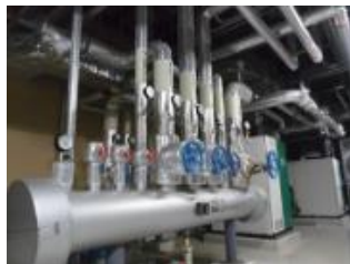
蒸気・エア・薬液配管、 何でもご相談ください！