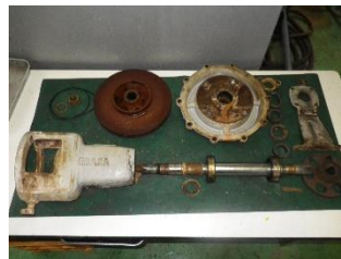
ポンプの分解整備 オーバーホール！