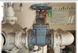
バルブ、減圧弁などの交換