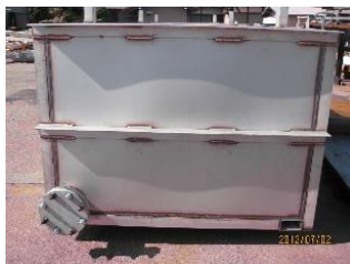
ご要望に応じた タンクを設計します！