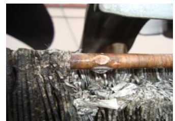
冷媒配管の 漏れ対策を行ないます！