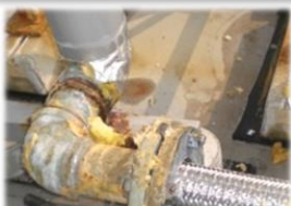
給排水管の腐食や詰まりの解消