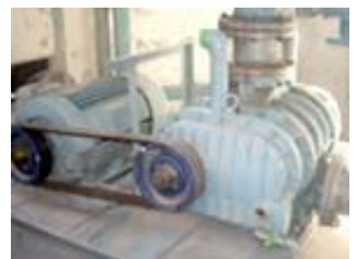
ブロウ、ファン などのメンテナンス！