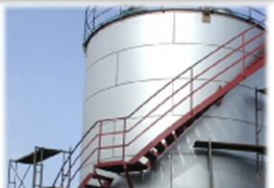
大型タンクの製作、メンテナンス