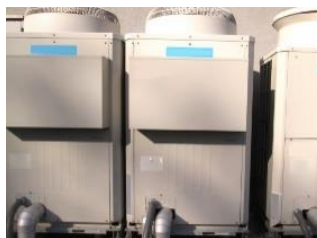
空調機器の部品交換 に対応します！