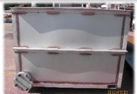
ニーズに合ったタンク、槽の制作