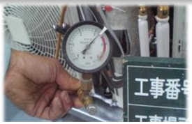
フロン点検をしていない