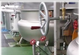
現場のタンクの補修