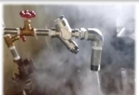
蒸気の漏れ対策など蒸気配管メンテナンス