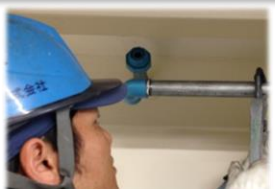
エア漏れ補修などエア配管メンテナンス