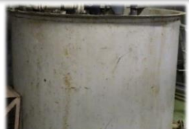
現場のタンクの腐食対策コーティング