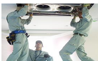
冷媒配管の距離が極端に長すぎる...