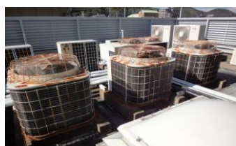
冷媒配管にピンホールが発生している...