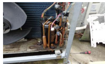
機器から異音が発生している...